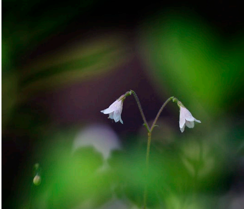
Linnea i Flatens naturreservat.